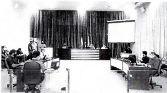
Sessão extraordinária da Câmara de Apucarana realizada ontem à tarde